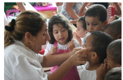
Projeto Saúde Educação em Saúde Bucal Prevenção